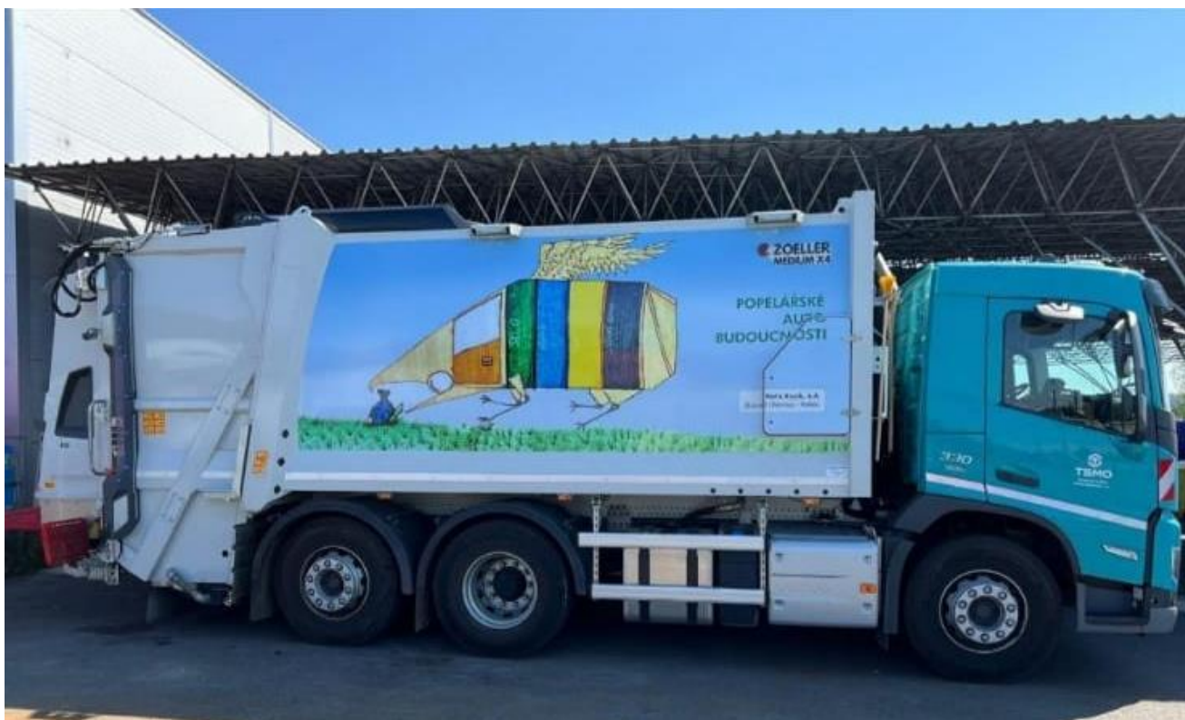
Zde vidíte auto s obrázkem v akci! 😊