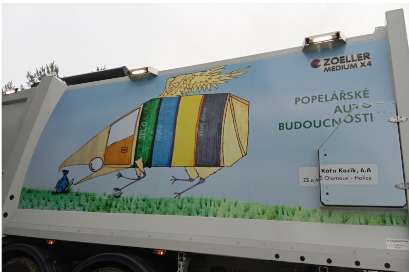
... a s detailem jména vítězky a naší školy 😊